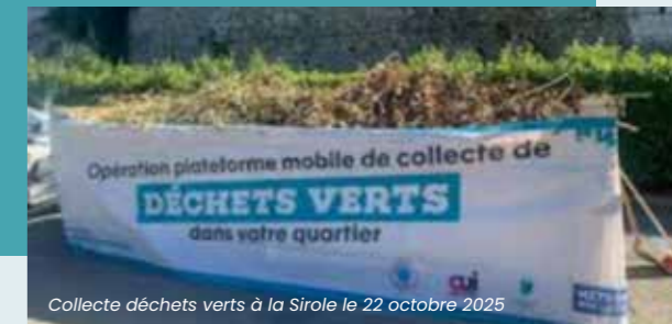
Collecte déchets verts à la Sirole le 22 octobre 2025