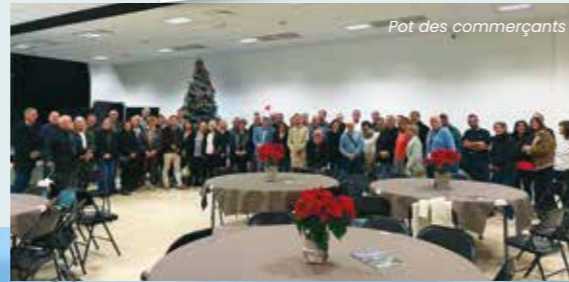
Pot des commerçants