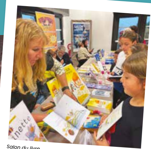
Salon du livre