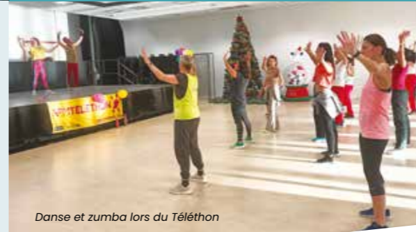
Danse et zumba lors du Téléthon