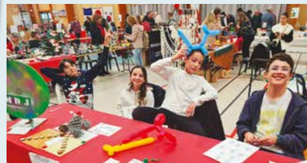
Les ados de la Maison des Jeunes au Marché de Noël