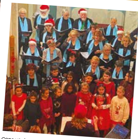
Concert de Noël