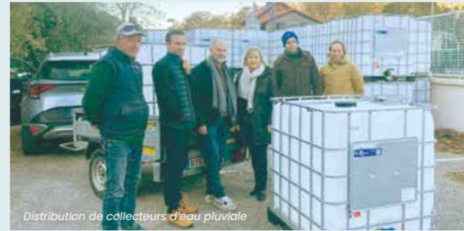
Distribution de collecteurs d'eau pluviale