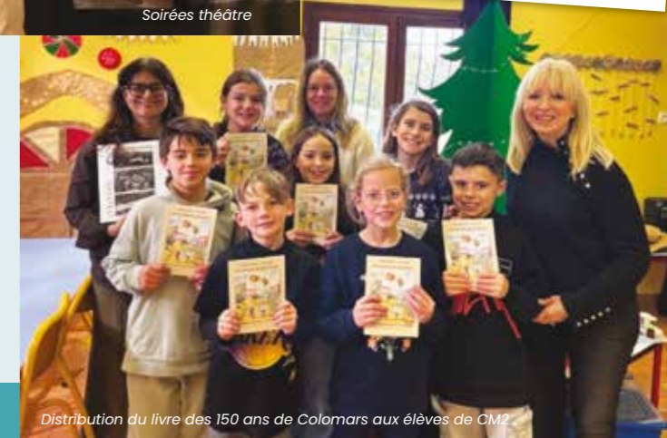
Distribution du livre des 150 ans de Colomars aux élèves de CM2