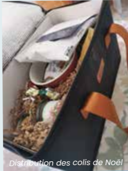
Distribution des colis de Noël