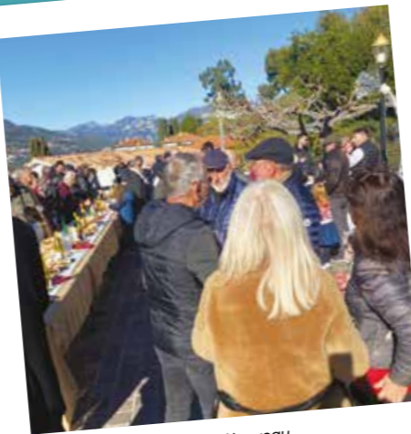
Dégustation du Beaujolais Nouveau par le Comité des Fêtes de Colomars