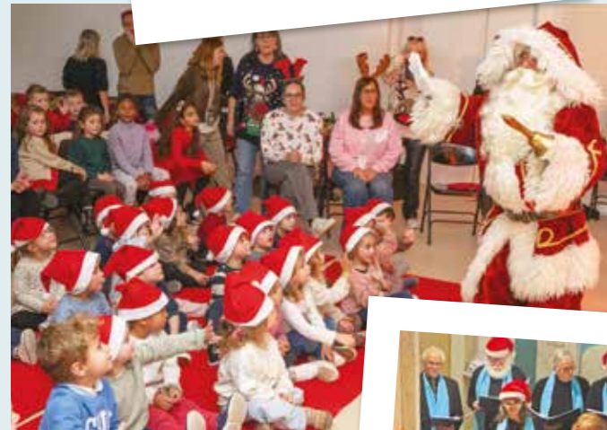
Spectacle et goûter de Noël des écoles