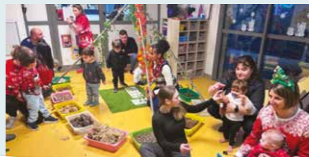
Goûter de Noël à la Crèche