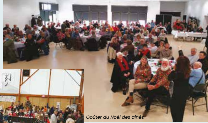
Goûter du Noël des aînés