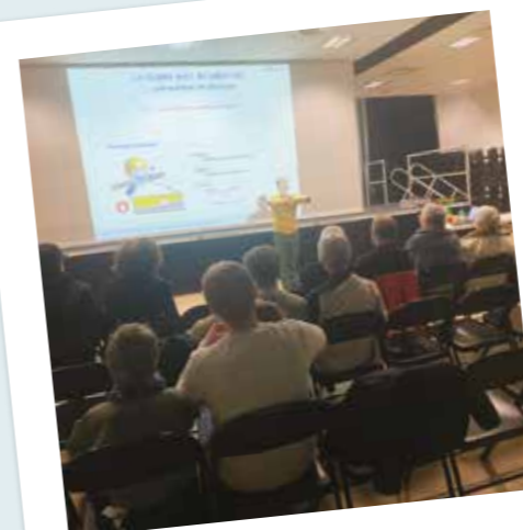
Vendredis de la science