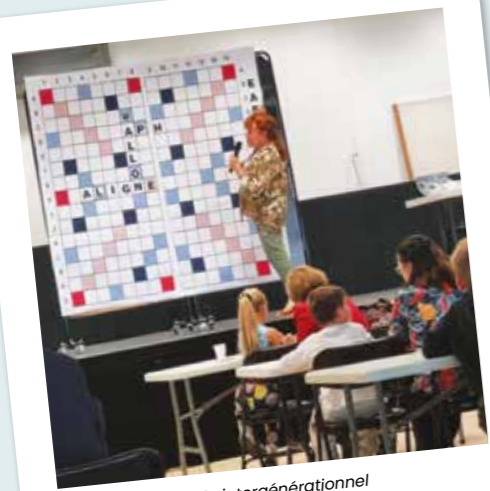
Tournoi de scrabble intergénérationnel